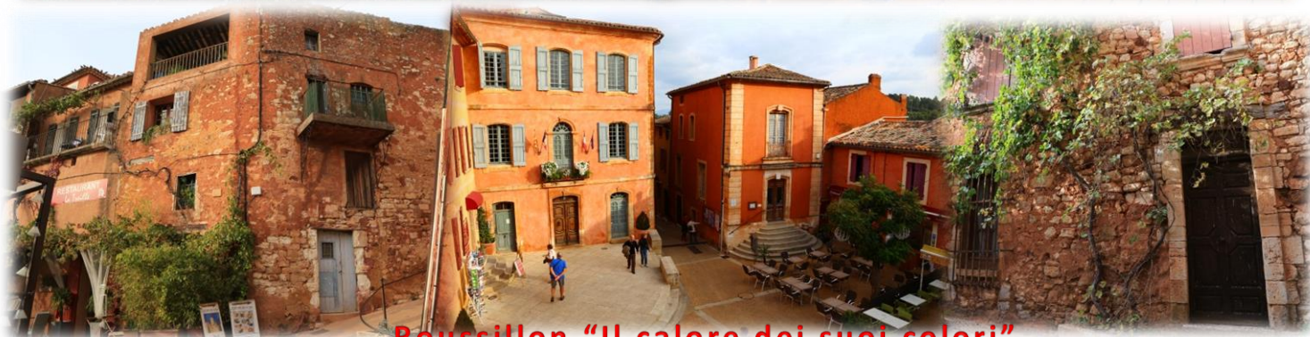
Roussillon "Il calore dei suoi colori"