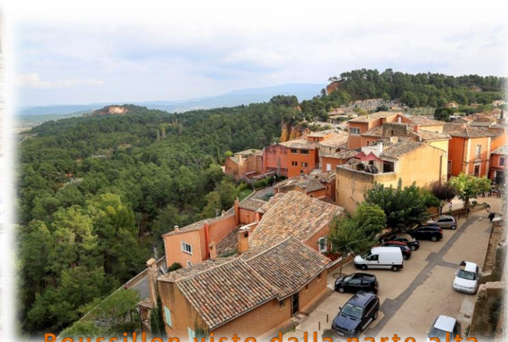
Roussillon visto dalla parte alta

Dopo aver pagato i 2€ per la sosta partiamo per Mènerbes , distante una quindicina di Chilometri. E' un altro bel borgo provenzale che come Roussillon fa parte de "les plus beaux villages de france" . Percorrendo delle strade piuttosto strette arriviamo nel parcheggio di Mènerbes dove è consentito anche pernottare. Si trova facilmente all'ingresso del paese arrivando dalla D900 in Rue de la Fontaine (lat N 43.83232° long E 5.20722° solo sosta). Quando giungiamo verso le 17:00 troviamo in sosta altri tre camper che ci faranno compagnia anche per la notte. Usciamo subito per visitare questo bel villaggio arroccato in cima a uno sperone roccioso che domina i vigneti e la macchia del Luberon. All'interno, le strade rivelano un ricco patrimonio: case medioevali l'antico municipio e la sua bella piazza su cui sorge un campanile-torre del XVII secolo. Saliamo verso il castello, da qui si gode un bel panorama, possiamo osservare due bei borghi