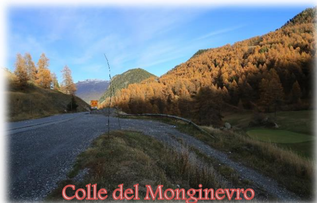
Colle del Monginevro

Proseguiamo sulla N85 sempre in direzione Sisteron, attraversata la quale ci fermiamo in un supermercato Super U' per fare un po' di spesa e acquistare prodotti alimentari francesi che da noi non si trovano. Prima di arrivare a Tallard , facciamo un'altra sosta in un parcheggio alberato lungo la strada per il pranzo. Ripartiamo sempre sulla N85 fino ad incrociare la N95 che prendiamo in direzione Briançon. Ogni tanto ci fermiamo, il bel pomeriggio di sole ci regala splendidi paesaggi autunnali che sono spunto per belle fotografie. Ci fermiamo anche sul colle del Monginevro per fare merenda e altre foto. Poco prima delle 19 siamo a casa.