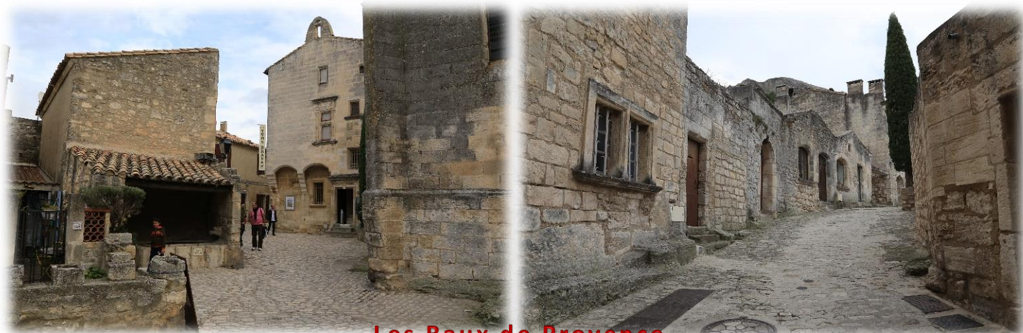
Les Baux de Provence