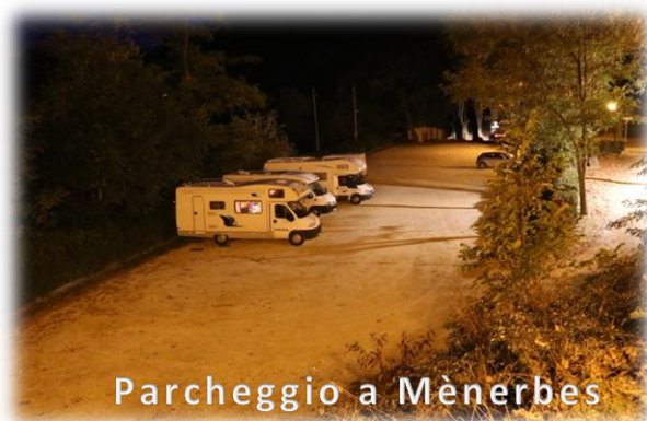
Parcheggio a Mènerbes

Dopo aver pagato i 2€ per la sosta partiamo per Mènerbes , distante una quindicina di Chilometri. E' un altro bel borgo provenzale che come Roussillon fa parte de "les plus beaux villages de france" . Percorrendo delle strade piuttosto strette arriviamo nel parcheggio di Mènerbes dove è consentito anche pernottare. Si trova facilmente all'ingresso del paese arrivando dalla D900 in Rue de la Fontaine (lat N 43.83232° long E 5.20722° solo sosta). Quando giungiamo verso le 17:00 troviamo in sosta altri tre camper che ci faranno compagnia anche per la notte. Usciamo subito per visitare questo bel villaggio arroccato in cima a uno sperone roccioso che domina i vigneti e la macchia del Luberon. All'interno, le strade rivelano un ricco patrimonio: case medioevali l'antico municipio e la sua bella piazza su cui sorge un campanile-torre del XVII secolo. Saliamo verso il castello, da qui si gode un bel panorama, possiamo osservare due bei borghi