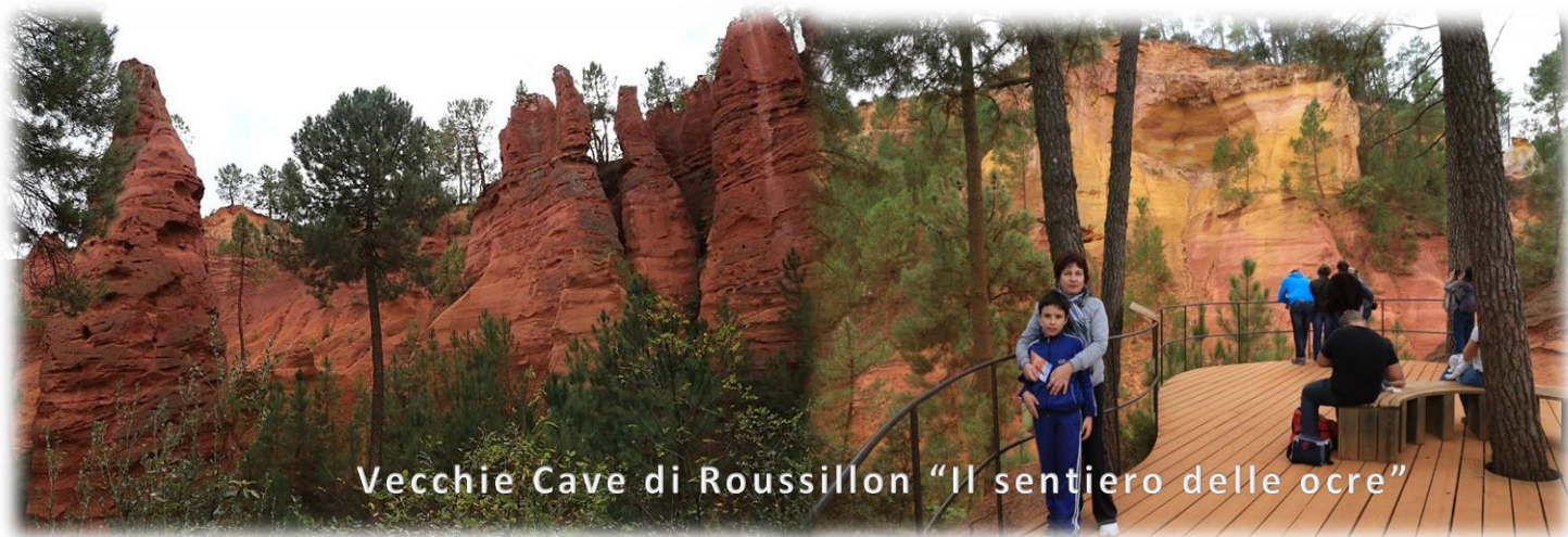
Vecchie Cave di Roussillon "Il sentiero delle ocre"