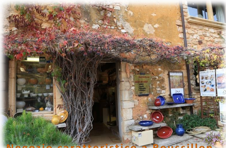
Negozio caratteristico a Roussillon